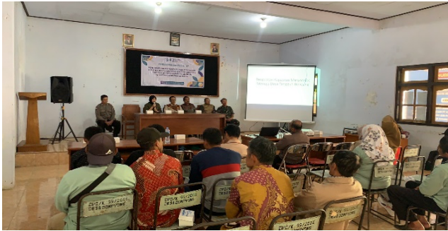
Gambar 1. Peta Sebaran Tanah Longsor

Wilis, pola hubungan kejadian longsor dengan kemiringan lereng hampir sama dengan cakupan DAS Sumberwangi. Jenis longsor sulit diidentifikasi karena kualitas visual citra Google Earth kurang baik di area studi.