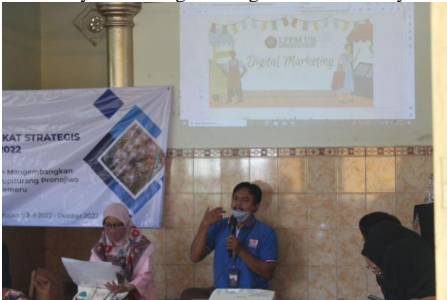
Gambar 3 Transfer Keilmuan

melaksanakan sendiri kegiatan digital marketing, Tim PMS Pronojiwo telah melakukan kegiatan transfer keilmuan terlebih dahulu. Kegiatan ini dilakukan guna mengenalkan apa itu digital marketing, tujuannya, manfaatnya serta langkah-langkah melakukannya.