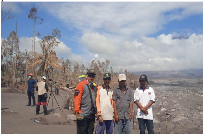
Gambar 2. Lahan Pertanian Hancur Akibat Erupsi

Masyarakat Desa Supiturang yang mayoritas petani memiliki semangat dan etos kerja yang tinggi, kondisi ini menjadi sebuah keunggulan tersendiri bagi Kabupaten Lumajang. Masyarakat Desa Supiturang bertani dengan menanam pohon salak untuk meningkatkan taraf hidup/ekonomi keluarganya. Pohon salak merupakan tanaman pertanian unggulan untuk menambah penghasilan/pendapatan masyarakat Desa Supiturang. Tepat tanggal 4 Desember 2021 ujian menimpa masyarakat Desa Supiturang Kecamatan Pronojiwo Kabupaten Lumajang, bencana alam awan panas yang disebabkan oleh meletusnya Gunung Semeru. Bencana tersebut menimpa puluhan hektar pertanian masyarakat sekitar termasuk beberapa hektar pohon salak rusak akibat tertimbun abu vulkanik.