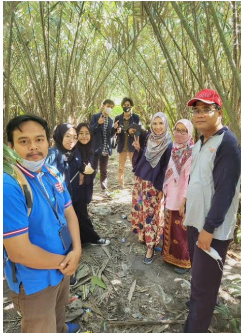
Gambar 6. Tim Pengabdian Lenngkap

Dalam aktivitas pengabdian di masyarakat tim melakukan kunjungan ke lahan pertanian salak masyarakat, dan mendapatkan informasi valid tentang potensi yang bisa dikembangkan. Masyarakat mitra saat ini memiliki 4000 tanaman buah salak yang selalu berbuah sepanjang tahun. Melihat karakteristik cara panen buah salak yang sangat menarik, bisa di panen setiap hari sesuka hati petani, maka keberadaan bahan baku buah segar salak menjadi sangat melimpah. Hal ini di dukung dengan bukti nyata sewaktu kunjungan ke lahan pertanian, muncul sebuah konsep ide baru yang akhirnya kami usulkan. Penerapan digital marketing tidak hanya mempromosikan buah salak segar supaya penjualan terus meningkat, namun juga mempromosikan keberadaan lahan yang luas dan melimpah. Dengan konsep wisata edukasi buat masyarakat di luar Desa Supiturang maka potensi lahan pertanian salak yang luas bisa menjadi salah satu destinasi yang mendatangkan uang.