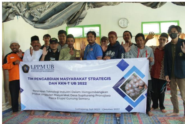
Gambar 5 Tim Bersama Masyarakat Petani

Setelah sesi praktek selesai, para pelaku usaha mulai mencoba langkah-langkah dalam menggunakan media digital dengan gadget milik mereka sendiri. Para mahasiswa disini tugasnya adalah mendampingi para pelaku usaha jika memiliki kesulitan dalam pengoperasian media digital. Selain itu mahasiswa juga memastikan bahwa para petani melakukan langkah-langkah yang benar serta memberikan masukan terkait digital marketing yang dilakukan. Kegiatan pendampingan ini dilakukan mulai dari pembuatan akun sampai nanti berakhirnya kegiatan pengabdian masyarakat. Tim pengabdian masyarakat dari mahasiswa terus mendampingi terkait digital marketing yang dilakukan pelaku usaha untuk terus mengembangkan penjualan produk buah salak segar.