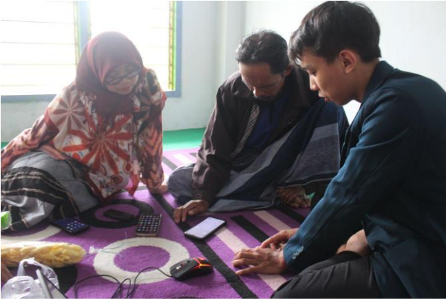
Gambar 4. Pendampingan Praktik Bersama Mahasiswa

Setelah sesi praktek selesai, para pelaku usaha mulai mencoba langkah-langkah dalam menggunakan media digital dengan gadget milik mereka sendiri. Para mahasiswa disini tugasnya adalah mendampingi para pelaku usaha jika memiliki kesulitan dalam pengoperasian media digital. Selain itu mahasiswa juga memastikan bahwa para petani melakukan langkah-langkah yang benar serta memberikan masukan terkait digital marketing yang dilakukan. Kegiatan pendampingan ini dilakukan mulai dari pembuatan akun sampai nanti berakhirnya kegiatan pengabdian masyarakat. Tim pengabdian masyarakat dari mahasiswa terus mendampingi terkait digital marketing yang dilakukan pelaku usaha untuk terus mengembangkan penjualan produk buah salak segar.