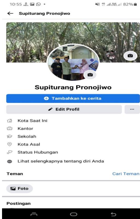
Gambar 7. Media Sosial FB

Facebook menjadi salah satu yang paling mudah dimengerti oleh masyarakat mitra petani salak dalam membuat akun promosi digital marketing. Untuk itu, pertama yang diajarkan adalah membuat akun facebook. Setelah itu baru membuat akun instagram, hal ini juga harus didukung kemampuan android masyarakat petani salak. Proses pendampingan masih berjalan sampai mitra bisa mandiri dalam mempromosikan produk pertaniannya.