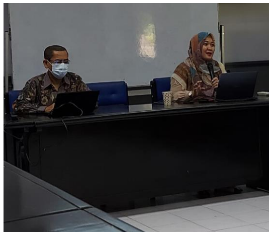
Gambar 3. Penyampaian materi oleh tim pengabdian pada tahap 1

karena itu guru harus melihat jam mengajarnya; 3) Pengamatan (observing), merupakan kegiatan pengamatan yang dilakukan oleh pengamat. Pengamat bisa dari teman sejawat atau guru sendiri. Pada tahap ini, guru pelaksana mencatat sedikit demi sedikit apa yang terjadi agar memperoleh data yang akurat untuk perbaikan siklus berikutnya. Pengamatan dilakukan pada saat pelaksanaan tindakan kelas dengan melakukan pencatatan-pencatatan, perekaman, dokumentasi pada gejala-gejala yang muncul pada saat pelaksanaan tindakan; 4) Refleksi (reflecting), merupakan kegiatan untuk mengemukakan kembali apa yang sudah dilakukan. Dalam tahap ini, guru berusaha untuk menemukan hal-hal yang sudah dirasakan memuaskan hati karena sudah sesuai dengan rancangan dan secara cermat mengenali hal-hal yang masih perlu diperbaiki. Pada tahap refleksi peneliti juga perlu untuk mengungkapkan hasil penelitian dengan megungkapkan kelebihan dan kekurangannya. Jika penelitin tindakan dilakukan melalui beberapa siklus, maka dalam refleksi terakhir, peneliti menyampaikan rencana penelitian berikutnya. Refleksi handaknya mengungkapkan kendala pada tahap pertama dan kekurangannya sehingga pada tahap berikutnya bisa memperbaiki penelitian tindakan.