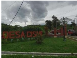
Gambar 1 Pintu Gerbang Desa Cisaat, Subang Jawa Barat

Pada perkembangannya, desa ini merupakan desa binaan Universitas Negeri Jakarta yang telah mendapatkan pengakuan secara nasional sebagai salah satu desa wisata terbaik (juara tiga nasional 2020) dengan konsep wisata edukasi. Partisipasi aktif masyarakat merupakan salah satu faktor berjalan dengan baiknya pembangunan desa. Namun demikian Desa Cisaat masih membutuhkan pendampingan terutama dalam menggaungkan namanya lebih luas lagi baik nasional maupun internasional.