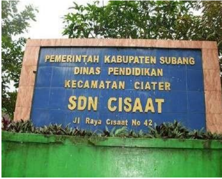
Gambar 2 SDN Cisaat Subang, Jawa Barat