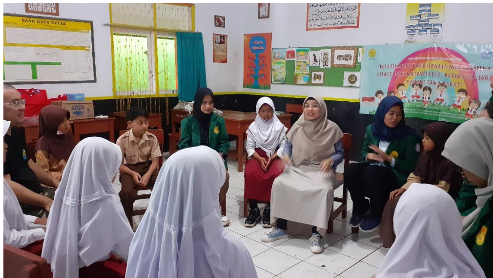
Kegiatan pemanasan sekaligus mengimplementasikan materi greetings

Setelah para peserta dapat melafalkan namanya dalam Bahasa Inggris dengan percaya diri, kegiatan dilanjutkan dengan berkomunikasi lewat media video interaktif. Video interaktif dibuat dengan menggunakan aplikasi renderforest. Tim menciptakan karakter virtual bernama “Lyra”. Lyra digambarkan sebagai siswa sekolah dasar dengan gaya rambut kepang dua untuk memunculkan kesan kekanakan dan lucu. Lyra juga menyandang tas agar para peserta merasa punya kesamaan dengan Lyra sebagai seorang siswa sekolah dasar.