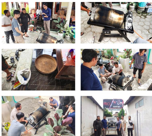
Gambar 4. Introduksi Alat/TTG Mesin Roasting Raw Green Coffee Beans

Introduksi alat/TTG dilakukan untuk menentukan tanggapan serta reaksi mitra terhadap suatu karya yang dirancang khusus untuk mitra, yaitu Mesin Roasting Raw Green Coffee Beans. Setelah dilakukan pendampingan selama sebulan terakhir, mitra melaporkan perkembangan, peningkatan efisiensi proses panen salak yang menjadi tujuan utama dari pengembangan produk Mesin Roasting Raw Green Coffee Beans, yaitu: a) produk berfungsi dengan baik serta bermanfaat bagi pemakainya, b) produk berfungsi: 1) memasak kopi, 2) mengeluarkan air dalam kopi, dan 3) mengeringkan dan mengembungkan bijinya, dan e) yang menarik dari Mesin Roasting Raw Green Coffee Beans adalah drum capacity-nya 10Kg/Batch.