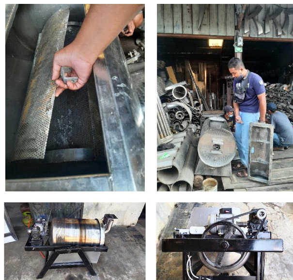
Gambar 3. Pengembangan produk Mesin Roasting Raw Green Coffee Beans

Pengembangan produk Mesin Roasting Raw Green Coffee Beans dilakukan dengan pekerjaan rancang-bangun meliputi: a) pengumpulan data (konsep rancangan, spesifikasi produk, perencanaan material dan prinsip kerja produk); b) pembuatan desain Mesin Roasting Raw Green Coffee Beans, meliputi desain assembly dan desain bagian-bagian komponen pada Mesin Roasting Raw Green Coffee Beans: 1) motor listrik, 2) kabel, 3) saklar, 4) steker, 5) roda, 6) tabung gas, 7) regulator, 8) selang gas, 9) kompor, 10) rangka, 11) tabung sangrai, 12) termometer, 13) fanbelt, 14) poros pengaduk, dan 15) puli; c) perencanaan elemen, yaitu mengurai raw material di dalam manufaktur-ing produk; dan d) uji coba fungsi di lab./bengkel tempat pengembangan Mesin Roasting Raw Green Coffee Beans.