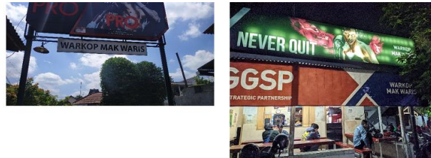
Gambar 2 . Survey Lokasi Warkop Waris

meningkatkan kematangan menyeluruh raw green coffe beans di Warkop Waris, 3) menentukan tujuan kerja: secara garis besar pekerjaan pengabdian ini terdiri dari rancang bangun dan penerapan TTG, dan 4) rencana untuk pemecahan masalah: merancang bangun Mesin Roasting Raw Green Coffee Beans untuk meningkatkan kematangan menyeluruh raw green coffe beans di Warkop Waris.