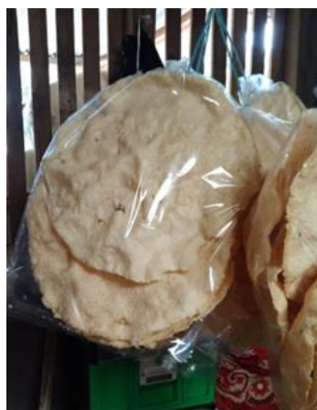
Gambar 1. Produk Kerupuk Samiler Abinyu

Setiap hari UMKM Abinyu membutuhkan kurang lebih 2 kwintal singkong untuk diolah menjadi kerupuk samiler. Proses pembuatan kerupuk samiler terdiri dari beberapa tahapan, yaitu (a) Pengupasan dan Pamarutan, (b) Perendaman dan Pemerasan, (c) Pemberian Bumbu dan Pencetakan, (d) Pengukusan, (e) Penjemuran/Pengeringan, (f) Penggorengan, dan (g) Pengemasan/Packing. Proses ini dilakukan dengan cermat agar menghasilkan produk berkualitas tinggi, terutama proses pengeringan/penjemuran (Raliby & Rusdijati, 2010).