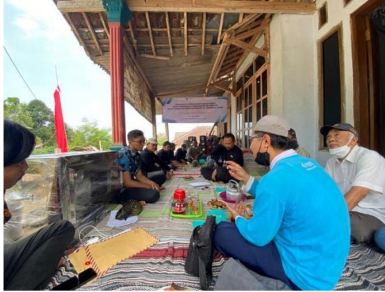
Gambar 9. Ketua Tim Pengabdian Bersama UMKM Abinyu