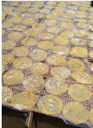
Gambar 2. Proses Penjemuran Kerupuk Samiler

Berdasarkan hasil wawancara dan diskusi yang sudah dilakukan dengan pelaku Usaha Mikro Kecil Menengah Abinyu yaitu Ibu Fariyani, didapatkan beberapa permasalahan dalam proses produksi, yaitu pada tahapan penjemuran/pengeringan dari kerupuk samiler. Selama ini, proses penjemuran dilakukan dengan meletakkan kerupuk samiler di atas wadah plastik dan ditempatkan pada jaring kayu yang berbentuk persegi panjang, kemudian diletakkan di bawah sinar matahari, seperti yang diperlihatkan pada Gambar 3. Karena proses penjemuran dilakukan di bawah sinar matahari, maka lama waktu penjemuran dipengaruhi oleh kondisi cuaca yang tidak menentu.