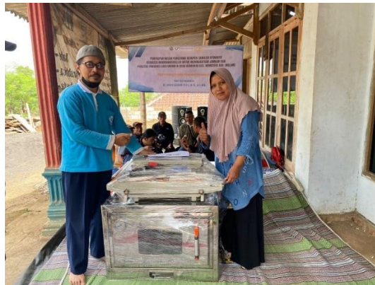
Gambar 8. Ketua Pengabdian dan Mitra Berfoto Untuk Penyerahan Alat

Setelah kegiatan sosialisasi dilakukan, selanjutnya dilanjutkan dengan proses penandatanganan antara tim pengabdian dengan pihak mitra. Kemudian dilanjutkan dengan penyerahan Mesin Pengereng Kerupuk Samiler Otomatis dari ketua tim pengabdian kepada pihak UMKM Abinyu.