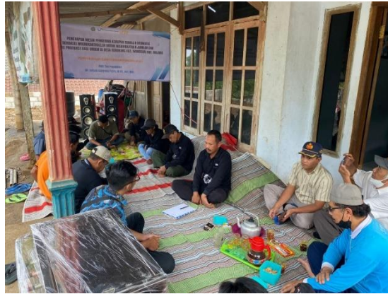
Gambar 1. Pembukaan Kegiatan