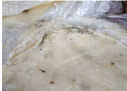
Gambar 3. Kerupuk Samiler Berjamur

Penurunan kualitas pada kerupuk samiler dapat menyebabkan kerugian, yaitu kerupuk samiler yang tidak kering akan dibuang, karena kerupuk berjamur dan rasa kecut/asam, sehingga tidak layak untuk dijual. Selain itu, UMKM Abinyu juga tidak dapat menyelesaikan pesanan akibat proses dari penjemuran kerupuk samiler yang memakan waktu lama.