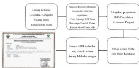
Gambar 2. Prosedur Pendaftaran Nomor P-IRT Secara Offline di Dinas Kesehatan

Secara online dengan pengisian formulir pendaftaran berbasis google formulir dan dilanjutkan pendaftaran melalui website spirt.pom.go.id