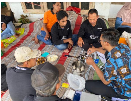
Gambar 8. Demo Alat