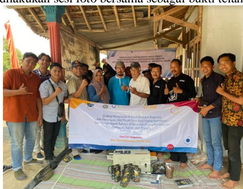
Gambar 9. Foto Bersama Kelompok Tani Ternak Ngudi Rahayu

Sebelum mengakhiri kegiatan dilakukan sesi foto bersama sebagai bukti telah melaksanakan kegiatan pengabdian.