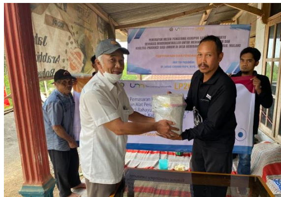
Gambar 7. Penyerahan dan Pendampingan Alat

Setelah dilakukan sambutan-sambutan, dilanjutkan dengan penyerahan alat kepada kelompok tani ternak Ngudi Rahayu.