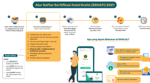
Gambar 5. Prosedur Pendaftaran Sertifikat Jaminan Halal Produk Secara Online