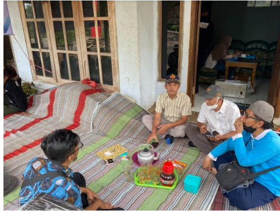
Gambar 6. Sosialisasi Legalitas Usaha

Pembukaan pelatihan dihadiri oleh beberapa kelompok tani ternak Ngudi Rahayu yang belum memiliki legalitas usaha untuk usahanya, packaging dan label yang belum sesuai, serta pemasaran yang belum maksimal.