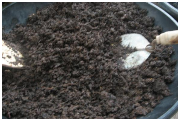
Gambar 5. Media Tanam Hasil Teknologi Komposter

Pengembangan dan penerapan teknologi komposter ini tidak hanya berkaitan dengan upaya pengelolaan sampah organik saja. Melainkan masih bisa dikembangkan untuk memberikan manfaat terkait pengembangan usaha media tanam. Hasil dari pengolahan sampah menggunakan teknologi komposter dapat dimanfaatkan oleh masyarakat untuk memproduksi media tanam dan menjualnya sehingga mampu menghasilkan nilai ekonomis. Terlebih lagi selama masa pandemi, mayoritas masyarakat memiliki hobi baru yakni bercocok tanam. Sehingga peluang bisnis media tanam dengan memanfaatkan sampah organik memiliki potensi yang cukup besar jika dikembangkan lebih jauh.