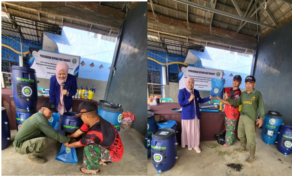
Gambar 6. Pengemasan Media Tanam Hasil Teknologi Komposter untuk Dijual