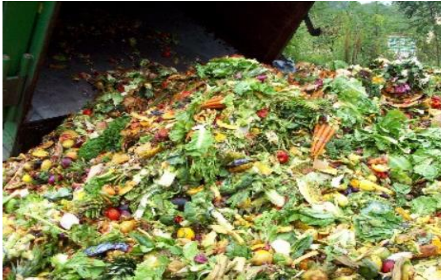
Gambar 2. Timbunan Sampah Organik di TPA