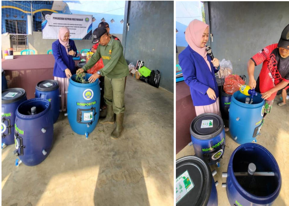
Gambar 4. Masyarakat Menerapkan Teknologi Komposter Untuk Pengolahan Sampah Organik

Pengembangan dan penerapan teknologi komposter ini tidak hanya berkaitan dengan upaya pengelolaan sampah organik saja. Melainkan masih bisa dikembangkan untuk memberikan manfaat terkait pengembangan usaha media tanam. Hasil dari pengolahan sampah menggunakan teknologi komposter dapat dimanfaatkan oleh masyarakat untuk memproduksi media tanam dan menjualnya sehingga mampu menghasilkan nilai ekonomis. Terlebih lagi selama masa pandemi, mayoritas masyarakat memiliki hobi baru yakni bercocok tanam. Sehingga peluang bisnis media tanam dengan memanfaatkan sampah organik memiliki potensi yang cukup besar jika dikembangkan lebih jauh.