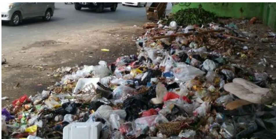
Gambar 3. Timbunan Sampah di TPS Pakisjajar

Pengolahan sampah yang baik diharapkan mampu memberikan andil dalam upaya menjaga kelestarian lingkungan (Cecep, 2012). Diperlukan kesadaran aktif dari setiap orang untuk mampu mengolah sampah organik yang dimiliki di masing-masing rumah. Oleh karenanya perlu adanya pengenalan, pengembangan, serta pendampingan untuk membuat teknologi skala rumah tangga yang berkaitan dengan pengolahan sampah organik. Salah satu teknologi yang dapat diterapkan yaitu teknologi komposter.