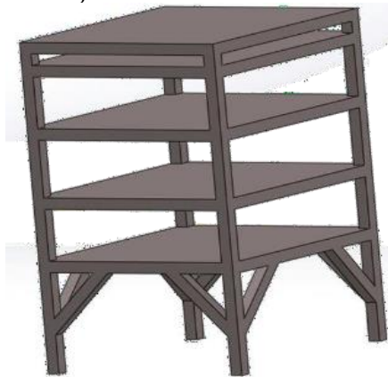
Gambar 3. Desain rancangan alat pengering ikan asin