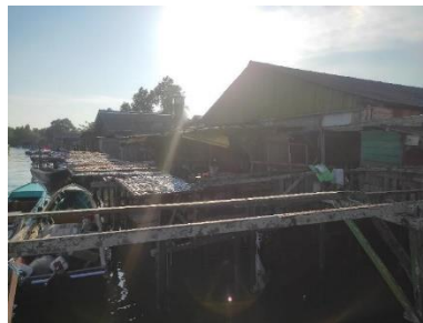
Gambar 2. Lokasi pengeringan ikan secara manual

Tahap survey lokasi bertujuan untuk menganalisis kebutuhan dan berbagai permasalahan yang dihadapi oleh warga setempat. Metode yang digunakan dalam tahapan ini adalah dengan melakukan wawancara langsung kepada Ketua RT dan warga setempat. Survey dilakukan di Manggar Baru RT 32 dimana mayoritas mata pencaharian warganya merupakan nelayan. Setelah dilakukan wawancara didapatkan permasalahan yang dialami beberapa warga sekitar yang berprofesi sebagai pembuat ikan asin, dimana pengeringan ikan asin memakan waktu 2 hari dan hanya dapat dilakukan ketika ada panas matahari.