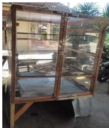
Gambar 4. Rancang bangun alat pengering ikan asin