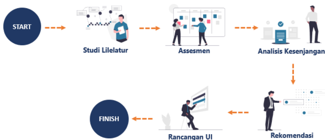
Gambar 1. Tahapan kegiatan