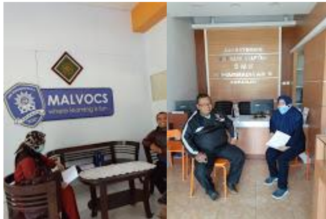
Gambar 1. Proses observasi dan diskusi dengan pihak sekolah

Pelaksanaan Pelatihan Penulisan Karya Ilmiah di Jurnal Nasional Bagi Guru-Guru SMK Muhammadiyah 5 Kapanjen meliputi antara lain: