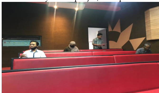
Gambar 1. Peserta mulai memasuki tempat pelatihan

Kegiatan Pelatihan Penulisan Karya Ilmiah Nasional di SMK Muhammadiyah 5 Kapanjen, Kabupaten Malang dilakukan dalam beberapa tahap. Kepala Sekolah dan Pengurus sekolah membantu mempersiapkan tempat dan mengkoordinir peserta pelatihan. Kegiatan pelatihan ini diikuti oleh 30 guru-guru yang ada di sana. Kegiatan tersebut dilaksanakan di gedung multimedia yang ada di SMK Muhammadiyah 5 Kapanjen, Kabupaten Malang.