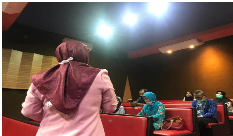
Gambar 3. Kegiatan pelatihan Penulisan karya ilmiah

Beberapa faktor penghambat guru untuk menghasilkan karya ilmiah diantaranya adalah: kebutuhan waktu yang relative lama untuk meningkatkan kemampuan memahami dan menulis sebuah karya ilmiah, tidak mudah dalam memotivasi guru untuk membuat sebuah karya tulis ilmiah. Serta adanya sikap pesimistis pada usaha peningkatan kemampuan kapabilitas guru tanpa dibarengi oleh penigkatan sarana dan prasarana yang memadai yang dibutuhkan dalam proses penulisan karya ilmiah tersebut.