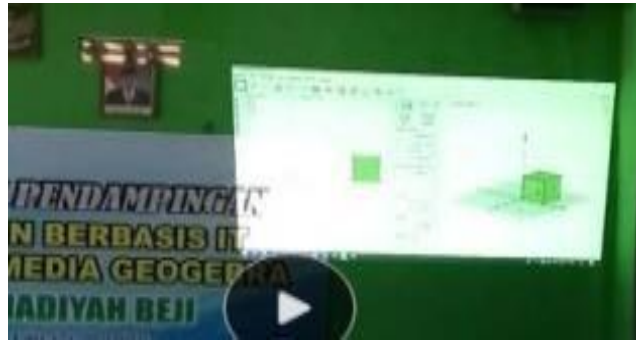
Gambar 4: Penayangan Materi Melalui LCD

Peserta secara individu berlatih membuat berbagai bangun geometri, seperti belah ketupat, segitiga dan jaring-jaring prisma serta pewarnaan dengan menggunakan laptop masing-masing peserta, seperti terlihat pada Gambar 5.