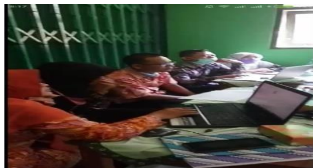
Gambar 2: Peserta Kelompok-1

Solusi yang kami lakukan agar kegiatan dapat berjalan adalah peserta dibagi dalam dua kelompok dan masing-masing kelompok dipandu oleh satu orang dosen dan satu orang mahasiswa, seperti pada Gambar 2 berikut.