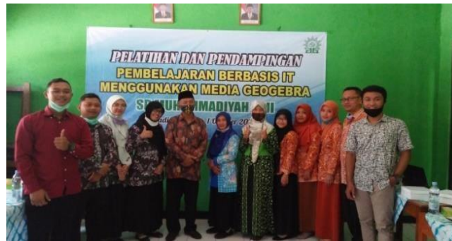
Gambar 1: Peserta Pelatihan dan TIM PPM UAD

Kegiatan pengabdian kepada masyarakat hari pertama diikuti oleh semua guru SD Muhammadiyah Beji. Semua peserta dan Tim PPM UAD terlihat pada gambar berikut.