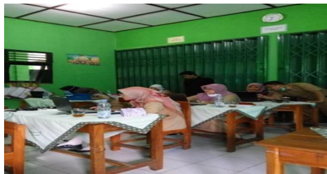
Gambar 5: Peserta Berlatih Menggunakan Aplikasi GeoGebra

Peserta secara individu berlatih membuat berbagai bangun geometri, seperti belah ketupat, segitiga dan jaring-jaring prisma serta pewarnaan dengan menggunakan laptop masing-masing peserta, seperti terlihat pada Gambar 5.