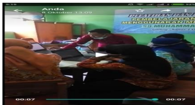
Gambar 3: Peserta kelompok 2

Pelaksanaan pendampingan Kelompok-2 berbeda dengan Kelompok-1. Pada kelompok ini dilakukan pendampingan per peserta sehingga penerimaan materi tidak secara bersamaan. Berikut adalah dokumentasi gambar peserta Kelompok-2,