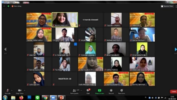
Gambar 2. Dokumentasi pelaksanaan pelatihan peningkatan softskill kewirausahaan melalui zoom