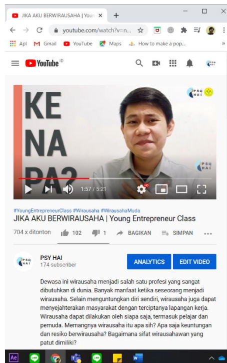
Gambar 3. Video motivasi berwirausaha pada youtube