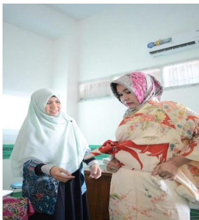
Gambar 4: Peserta wanita mulai mampu mengenakan yukata secara mandiri