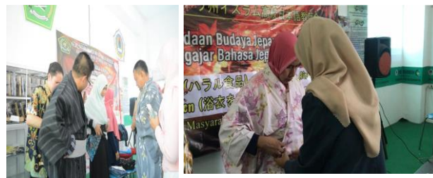
Gambar 3: Peserta yang kesulitan dibantu tim Pengabdian pada saat praktek menggunakan yukata.

Pada awalnya, beberapa peserta kesulitan menggunakan yukata. Hal ini dikarenakan mereka belum terbiasa menggunakan pakaian khas dari negeri Jepang ini.