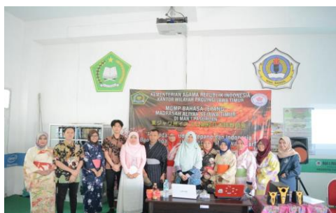
Gambar 5: Sesi foto bersama dengan para peserta yang telah berhasil menggunakan yukata secara mandiri

Di akhir sesi, tim pengabdian beserta para peserta pelatihan yang berhasil mengenakan yukata secara mandiri berfoto bersama tim pengabdian, sekaligus menjadi sebagai bukti bahwa pelatihan softskill telah berhasil dilaksanakan dan para peserta telah mampu meningkatkan kemampuannya dalam menggunakan yukata secara mandiri.