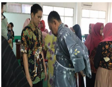
Gambar 5: Tim Pengabdian mengecek peserta pria

Pelatihan menggunakan yukata sangat diminati oleh para peserta. Hal ini dikarenakan tidak banyak yang memiliki pakaian khas Jepang ini, sehingga sesi implementasi mengenakan yukata secara mandiri sangat dinanti oleh sebagian besar peserta.