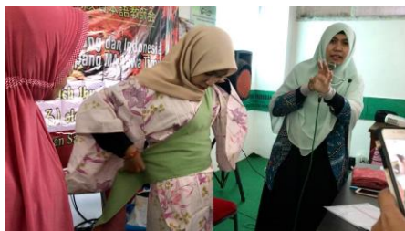
Gambar 2 Tim Pengabdian memberikan contoh cara mengenakan yukata secara mandiri