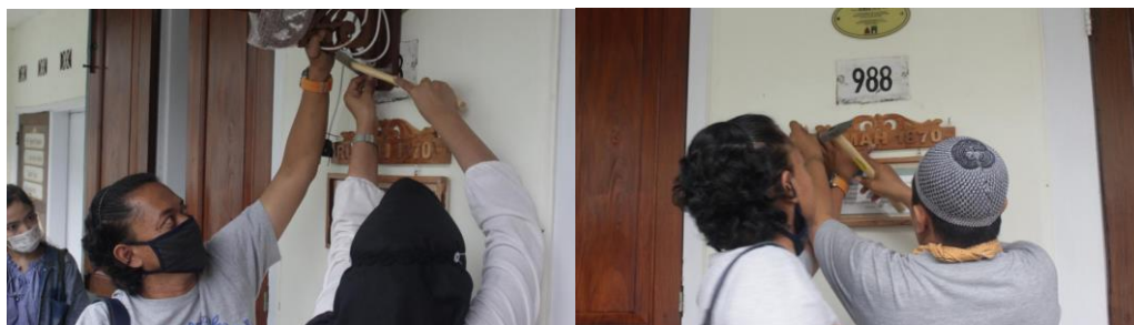
Gambar 6. Proses Display Sign System dan Kap Lampu