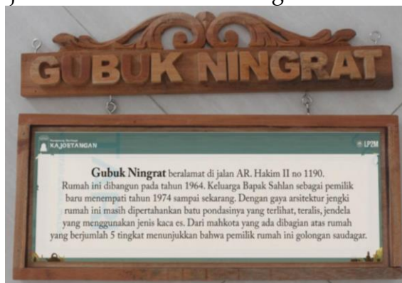
Gambar 5. Hasil Penggabungan Papan Nama dan Deskripsi

Terdapat sedikit perbedaan proses pembuatan karya yang dilakukan ketika proses perwujudan karya sign system . Deskripsi objek wisata digambarkan dalam bentuk infografis yang kemudian digabungkan atau dijadikan satu dengan papan nama objek wisata. Desain sign system pada dasarnya dibuat sama antara 1 dengan lainnya yaitu menampilkan ukiran dari ornamen fauna pada bagian atasnya dan kotak/persegi panjang sebagai pigura deskripsi objek wisata di bagian bawahnya. Nama objek dan deskripsi objek yang dibuat menjadi sign system antara lain Rumah Namsin, Rumah Penghulu, Rumah Jengki, Rumah 1870, Rumah Rindu, Rumah Cerobong, Rumah Nyik Aisyah, Rumah Mbah Ndut, Rumah Kartini, Omah Dawet Ireng, Rumah Pak Sutikno, Rumah Pak Sakirman, Rumah Tua, Tangga Seribu, Gubug Ningrat, Rumah Jacoeb, Galeri Nyak Abbas Akup, Rumah Punden, Rumah Pak Udin, Galeri Pak Eko, Rumah Ranuatmodjo, Langgar Tua, Rumah Jamu, dan Galeri AEO. Berikut contoh deskripsi objek yang diwujudkan dalam bentuk infografis.