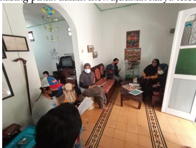
Gambar 1. Proses Koordinasi dan Sosialisasi

Kegiatan Pengabdian Kepada Masyarakat yang dilakukan oleh tim pengabdian dapat berjalan dengan lancar ketika program ini didukung oleh mitra program selaku pengguna atau tim yang diajak bekerjasama merealisasikan kegiatan. Proses koordinasi ini penting dilakukan untuk memberikan arahan atau pemecahan secara bersama sehingga kegiatan ini menghasilkan suatu produk yang sesuai dengan harapan bersama. Pada proses ini, sebelum merealisasikan kegiatan, tim pengabdian melakukan koordinasi kegiatan dengan mitra sehingga diperoleh kesepakatan tentang peran masing-masing pihak dalam mewujudkan karya tersebut.