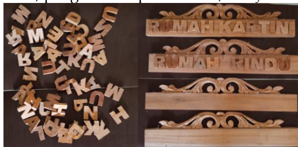
Gambar 4. Gambar Proses Pembuatan Sign System

Proses diawali dengan memindahkan pola atau gambar desain ke atas permukaan kayu. Setelah itu, kayu akan dipotong menggunakan mesin scroll dan diukir secara manual menggunakan tatah atau alat ukir. Setelah setiap bagian terpotong sesuai pola, selanjutnya dilakukan proses perangkaian, penghalusan permukaan, dan finishing akhir.