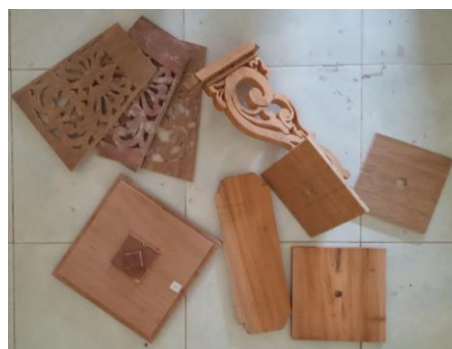
Gambar 4. Gambar Proses Pembuatan Kap Lampu