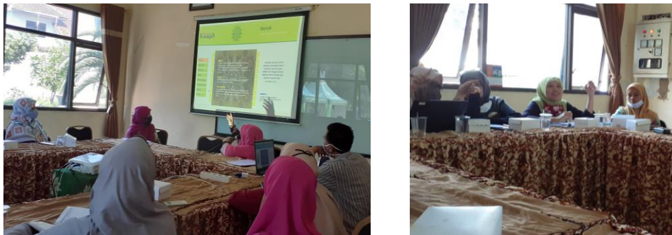
Gambar 2. Sosialisasi dan Focus group Discussion (FGD)

pelatihan yang terdiri atas pengelola TK ABA (kepala sekolah atau bendahara), anggota IGABA (Ikatan Guru Aisyah Busthanul Athfal), pihak PCA Lowokwaru, serta perwakilan dari PCA lain yang berada di kota Malang. Kegiatan terbagi menjadi dua kegiatan, kegiatan awal berupa sosialisasi dan focus group discussion (FGD) dengan mengikuti standar protokol kesehatan seperti yang tertera pada gambar berikut: