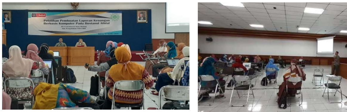
Gambar 3. Pelatihan pengoperasian laporan keuangan berbasis komputer

Dalam pelatihan ini disampaikan pula beberapa pengetahuan dasar terkait konsep akuntansi serta jurnal-jurnal yang ada dalam software laporan keuangan yang akan digunakan berupa laporan arus kas, laporan laba rugi, laporan perubahan modal serta neraca. Laporan arus kas berisikan jumlah penerimaan dan pengeluaran kas TK ABA dalam satu periode beserta sumber-sumbernya. Laporan laba rugi berisikan aktifitas bisnis TK ABA misalnya penerimaan, biaya seragam, atau beban yang harus dikeluarkan. Laporan perubahan modal berisikan peningkatan atau penurunan aktiva bersih yang didapatkan oleh TK ABA. Neraca berfungsi menjelaskan aset, kewajiban dan modal TK ABA dalam satu periode pengoperasiannya. Kegiatan ini ditambahkan juga sesi diskusi apabila ada bagian-bagian terkait software yang kurang dipahami oleh peserta pelatihan. Pada saat diskusi peserta berperan aktif dalam melakukan tanya jawab serta kendala yang dihadapi oleh TK masing-masing. Dampak dari kegiatan pelatihan ini yaitu pihak pengelola TK ABA tidak lagi menggunakan cara manual (dengan mencatat dibuku) dan beralih menggunakan software sehingga memudahkan dalam pengoperasian serta memiliki default berbagai laporan yang dibutuhkan seperti yang ditampilkan dalam gambar 4 berikut: