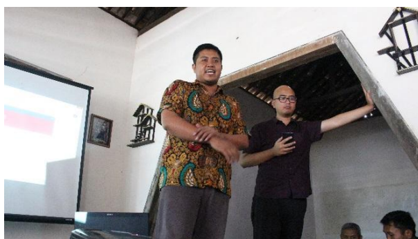
Gambar 3. Pemaparan materi dasar pengelolaan uang kas