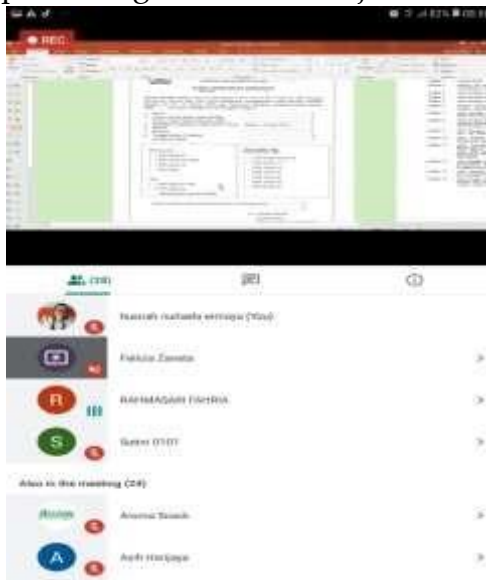
Gambar 6. Peserta kegiatan Edukasi Perpajakan

Media. Dengan adanya sosialisasi ini, pelaku UMKM kini mengetahui besarnya tarif pajak terbaru yang dibebankan kepada pelaku UMKM dan insentif pajak yang diberikan Pemerintah di masa pandemi covid-19. Peserta yang belum memiliki Nomor Pokok Wajib Pajak (NPWP) dan Surat Keterangan Terdaftar (SKT) kini memiliki informasi mengenai (1) prosedur pengurusan NPWP dan SKT (2) persyaratan dokumen yang harus dilengkapi oleh calon wajib pajak. Peserta juga memperoleh pemahaman mengenai Pajak Pertambahan Nilai terkait dengan (1) definisi, syarat Pengusaha Kena Pajak (2) Insentif yang diberikan kepada Pengusaha Kena Pajak.