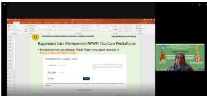
Gambar 5. Presentasi Materi oleh Ketua Tim Pengabdi

Tahapan Ketiga dari kegiatan pengabdian masyarakat ini adalah kegiatan inti, yaitu sosialisasi dan pelatihan perpajakan. Materi pelatihan yang diberikan antara lain mencakup (1) Sosialisasi Peraturan Pemerintah No. 23 tahun 2018 tentang tarif pajak sebesar 0,5% dan Peraturan Menteri Keuangan (PMK) nomor 44/PMK.03/2020 tentang insentif pajak di masa pandemic Covid-19 (2) Tata Cara Memperoleh NPWP dan Surat Keterangan Terdaftar atau SKT (3) Jenis Pajak yang harus dibayar oleh Pelaku UMKM (3) Tata Cara Penyetoran dan Pelaporan Pajak bagi UMKM.