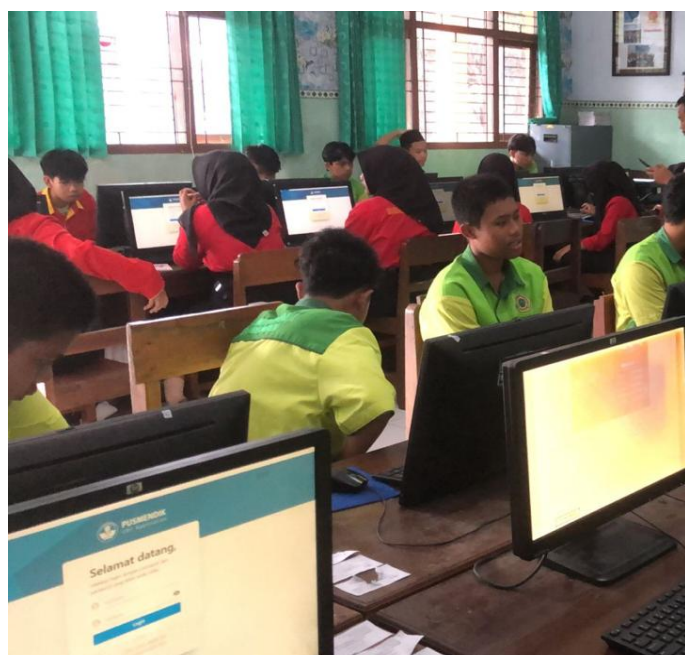
Gambar 3. Foto Dokumentasi Pengabdian