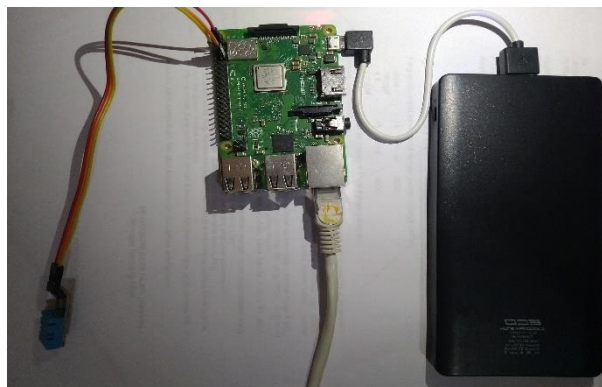
Gambar 1. Rangkaian Raspberry Pi dan DHT11.

Pengiriman menuju android menggunakan sambungan bluetooth dilakukan dengan cara mengimpor modul bluetooth dalam program sehingga bluetooth dalam Raspberry Pi bisa dioperasikan. Pengoperasian bluetooth sebelumnya perlu membuat soket sambungan untuk layanan rftcomm sebagai bluetooth server sehingga bluetooth bersedia menerima jika ada client yang akan terhubung. Setelah ada bluetooth client yang terhubung, Raspberry Pi akan menerima sambungan dan menyimpan alamat client . Selanjutnya Raspberry Pi akan mengirimkan data sensor suhu dan kelembapan yang tadi sudah dibaca menuju android, dengan kode program sebagai berikut.