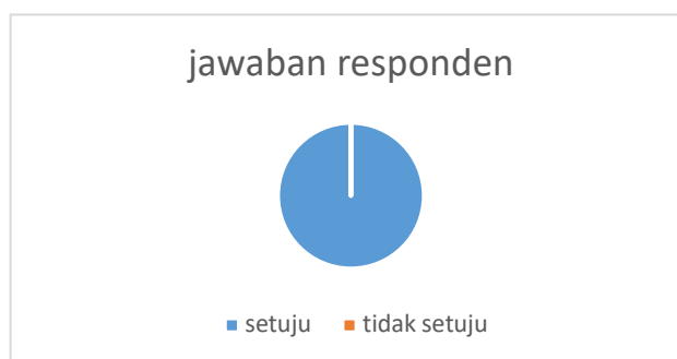
Gambar 2. Jawaban Responden

Dari pertanyaan tersebut semua responden menjawab pertanyaan dengan jawaban yang sama, yaitu mereka berpendapat bahwa adanya digitalisasi koperasi dapat memudahkan UMKM dalam mengakses berita dan informasi mengenai kegiatan yang dilakukan oleh koperasi. Hal ini dapat dilihat pada gambar grafik dibawah ini.