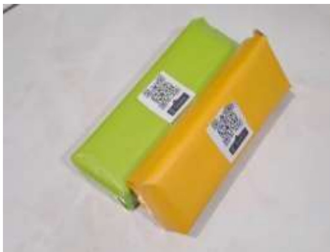
Gambar 2. Susunan Balok

Pada bagian utama media, peneliti membuat media dalam bentuk balok yang merupakan pengembangan dari permainan Uno Stacko .