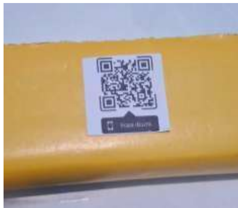
Gambar 4. QR materi