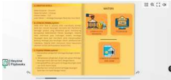
Gambar 3. Materi dalam bentuk Flipbook