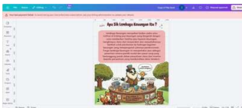
Gambar 3. Visualisasi AI pada EduFlip Finance Classroom

Seluruh konten teks yang telah disederhanakan dan aset visual hasil AI ini kemudian diintegrasikan ke dalam platform desain Canva. Setelah itu akan disusun tata letaknya dengan prinsip mobile-first accessibility , untuk memastikan proporsi gambar dan ukuran teks optimal saat diakses melalui perangkat seluler. Peta Konsep yang telah dirancang sebelumnya diterapkan sebagai halaman navigasi awal untuk memberikan gambaran besar kepada siswa sebelum mendalami materi secara mandiri.