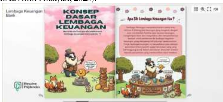
Gambar 4. Realisasi EduFlip Finance Classroom dengan Heyzine