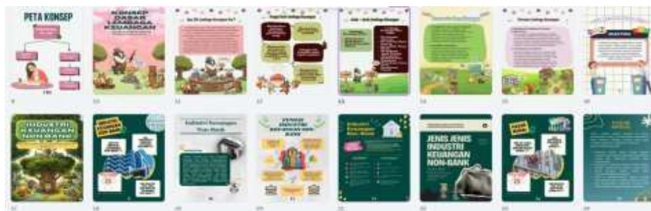
Gambar 2. Perancangan Desain EduFlip Finance Classroom

Seluruh elemen perancangan yang ter-integrasi ke dalam peta konsep yang sistematis dan desain visual yang atraktif melalui bantuan platform Canva untuk penyusunan ini bertujuan untuk mentransformasi materi LKNB yang semula bersifat tekstual-pasif menjadi materi yang bersifat visual-interaktif (Pudjianto et al., 2021). Dengan mengutamakan kemudahan akses melalui perangkat seluler, rancangan ini diharapkan dapat mereduksi beban kognitif dari siswa sekaligus bisa meningkatkan retensi pemahaman mereka terhadap materi LKNB dan OJK. Tahap perancangan selanjutnya akan menjadi acuan pada tahap pengembangan (development) untuk mengeksekusi produksi media menggunakan bantuan AI generatif secara mendetail.