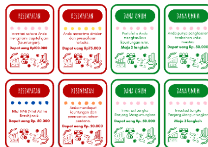
Gambar 2. Kartu Kesempatan dan Dana Umum