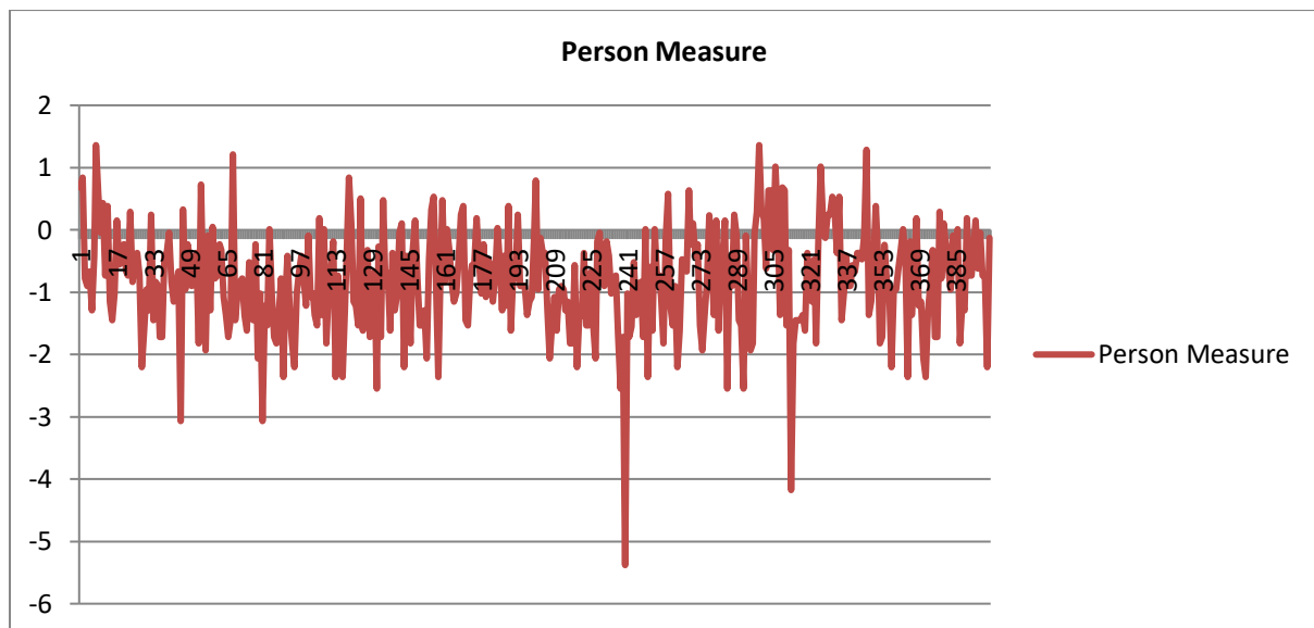
Gambar 2. Uji Person Measure

Salah satu tujuan utama analisis dengan Rasch Measurement Tool (RMT) memudahkan untuk memahami data dengan cara yang sederhana (Rangka et al., 2018). Data yang dikembangkan oleh RMT selalu mempunyai jarak yang sama ( equal interval ), karena terjadi transformasi data dari odd ratio dengan logaritma atau biasa disebut logit [29]. Detail informasi person measure dalam penelitian ini dapat diperoleh melalui link https://osf.io/bzqwg/ .