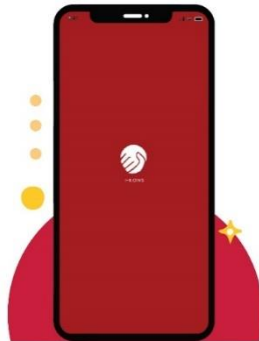
Gambar 1. Tampilan menu awal IKONS

Langkah awala menggunakan apliakasi IKONS adalah dnegan mengakses menu utama. Dalam menu utama akan disajikan tampilan layara berwarna merah disertai dengan loo aplikasi ikons berupa logo tangan berwarna putih. Tampilan menu utama akan tampak seperti gambar dibawah ini: