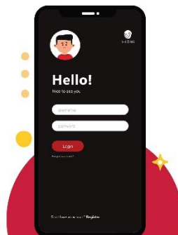
Gambar 4. Tampilan menu login

Setelah melakukan langkah ketiga yaitu membaca petunjuk singkat aplikasi, maka pada tahap ini anda diwajibkan masuk menu login. Dalam menu ini anda diprasyartkan mengisi username dan password. Username berupa kode NISN dan password sesuai keinginan. Yan telah diregistrasikan pada laman register. Gambar menu register akan tampak seperti gambar dibawah ini: