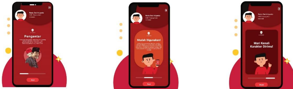
Gambar 3. Tampilan menu register

ajakan untuk memulai aplikasi. Pastikan anda cermat dan teliti dalam membaca petunjuk ini sebelum masuk menu pengisian inventori. Gambar menu register akan tampak seperti gambar dibawah ini: