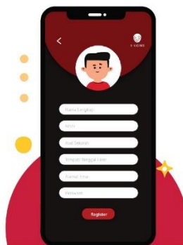
Gambar 2. Tampilan menu register

Setelah melakukan Langkah pertama yaitu masuk tampilan awal aplikasi, maka pada tahap ini anda diwajibkan masuk menu register. Dalam menu ini anda diprasyartkan mengisi biodata diri seperti: nama lengkap, NISN, asal sekolah, tempat tanggal lahir, alamat email, dan password. Gambar menu register akan tampak seperti gambar dibawah ini: