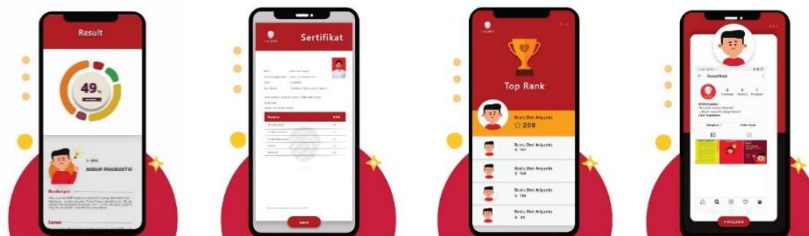
Gambar 6. Tampilan hasil pengisian aplikasi IKONS

Setelah melakukan langkah pengisian inventori, maka pada langkah ini anda akan mengetahui tampilan hasil atau output dari butir-butir inventori yang telah dikerjakan. Dalam menu hasil ada 3 tampilan menu utama yaitu result, sertifikat, top rank, dan share yang terkoneksi dengan akun Instagram aplikasi IKONS. Pertama , menu result akan menampilkan persentase lauran hasil pengisian inventori. Persentase yang Nampak adaah persentase tertinggi dari salah satu karakter. Kemudian di bagian bawah persentase aka nada ikon animasi yang mewakili nilai-nilai setiap karakter (ada 5 ikon gambar). Setiap ikon karakter dilengkapi denga deskripsi nilai tiap karakter dan saran kegiatan yang dapat dilakukan untuk meningkatkan nilai masin-masing karakter. Kedua , menu save akan menampilkan luaran berupa sertifikat. Deskripsi sertifikat akan memuat bisodata diri beserta foro pribadi dan hasil angka tiap nilai-nilai karakter. Ketiga , menu top rank berisi peringkat 10 besar peserta yang telah mengisi aplikai dengan skor tinggi. Keempat , menu share akan terkoneksi dengan akun social media Instagram IKONS yang didalamnya memuat edukasi terkait karakter.