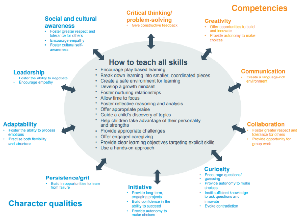
Gambar 3 Kualitas karakter dan kompetensi abad 21

World Economic Forum melalui artikel berjudul New Vision for Education: Fostering Social and Emotional Learning through Technology menyatakan bahwa untuk berkembang di abad 21, siswa membutuhkan lebih dari sekadar pembelajaran akademis dan tradisional. Mereka harus mahir dalam kolaborasi, komunikasi, dan pemecahan masalah, yang merupakan beberapa keterampilan yang dikembangkan melalui Social and Emotional Learning (SEL) atau pembelajaran sosial dan emosional. Ditambah dengan penguasaan keterampilan tradisional, kemahiran sosial dan emosional akan membekali siswa untuk berhasil dalam ekonomi digital yang berkembang pesat.