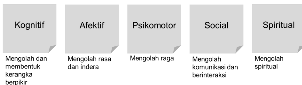
Gambar 5 Aspek dalam pendidikan holistik

Pendidikan holistik memberikan ruang kepada guru untuk berperan sebagai teman, fasilitator dalam belajar, sekaligus mentor, ketimbang mengontrol penuh dan memimpin proses pembelajaran (Gambar 5). Forbes and Robin (2004) dalam Widyastono (2012) menganalogikan bahwa peran guru seperti “seorang teman yang berpengalaman dan menyenangkan di saat menempuh sebuah perjalanan.” Demikian hendaknya sebuah sekolah dan guru memposisikan diri sebagai sebuah tempat bermain dan belajar di mana siswa merasa selayaknya di rumah yang menyenangkan. Komunikasi yang dibangun dengan siswa tentunya bukan bersifat top-down dan instruksional melainkan sebagai percakapan yang ramah, akrab, dan bersahabat. Pendidikan holistik lebih mengedepankan kolaborasi antar siswa ketimbang kompetisi. Dengan kolaborasi siswa belajar untuk menerima keberadaanya temannya, belajar melihat dan merasakan perbedaan, serta belajar dari perbedaan itu. Dengan demikian mereka akan terbiasa menerima dan menghargai perbedaan.