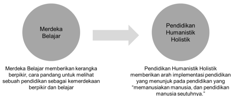
Gambar 4 Merdeka Belajar sebagai kerangka bagi Pendidikan Humanistik Holistik

Empat kemampuan abad 21 yang disebutkan sebelumnya tentu sangat sejalan dengan gagasan yang dibangun melalui Merdeka Belajar yaitu memberikan bekal literasi, numerasi, dan diperkuat dengan kualitas karakter (Gambar 4). Persepsi, konsepsi, serta implementasi tentang Merdeka Belajar harus membekali peserta didik dengan kemampuan berpikir (kognitif), bersikap (afektif), dan bertindak laku (konatif), serta dengan membekali kemampuan berkomunikasi, kolaborasi, berpikir kritis dan pemecahan masalah, kreativitas dan inovasi maka paradigma pendidikan yang perlu dibangun adalah pendidikan yang humanistik dan holistik.