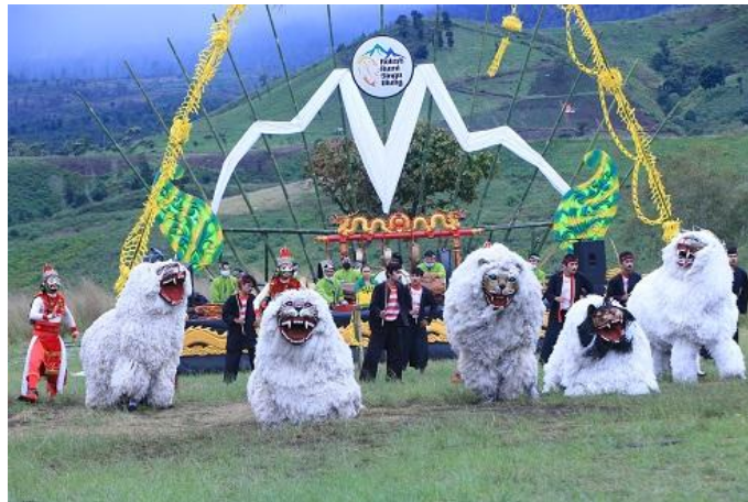
Gambar 2: Singo Ulung (Budi, 2021)

Tradisi Singo Ulung tidak lepas dari kisah ketokohan Juk Seng seperti yang telah diceritakan sebelumnya. Di Desa Blimbing Kabupaten Bondowoso terdapat tradisi kesenian Singo Ulung. Singo Ulung pada dasarnya merupakan gelar yang dimiliki oleh Juk Seng yang bersahabat dengan seekor singa yang kemudian di gambarkan dalam bentuk tarian dengan menggunakan kostum singa berwarna putih. Pelestarian budaya ini oleh masyarakat Blimbing merupakan upaya untuk memelihara warisan leluhur yaitu mengenai ketokohan Juk Seng dan Jasiman dalam membabat Desa Blimbing Kabupaten Bondowoso. Pelestarian kebudayaan ini rutin dilaksanakan pada tanggal 15 Syaban yang bertepatan dengan purnama dan dilaksanakan juga saat menjelang bulan Ramadhan. Masyarakat dari seluruh kalangan dari anak – anak hingga orang dewasa sangat antusias dalam kegiatan pelestarian budaya ini. Bahkan pemerintah daerah melalui kebijakannya rutin menyelenggarakan agenda ini setiap tahunnya di Alun-alun Kota Kabupaten Bondowoso.