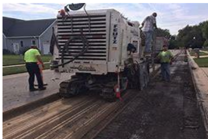
Gambar 1 Cold Milling Machine

Penanganan kerusakan jalan dengan metode perataan dan pengupasan lapis permukaan jalan eksisting menggunakan alat Cold Milling Machine seperti ditunjukkan Gambar 1 bertujuan meningkatkan nilai kerataan jalan sebagaimana hasilnya ditunjukkan Gambar 2. Biaya pemeliharaan perkerasan jalan aspal cenderung terus bertambah sehingga diperlukan suatu inovasi dalam pemeliharaan jalan guna mempertahankan atau menambah umur rencana bagi peningkatan layanan lalu lintas kendaraan. Perkerasan yang kuat, tahan lama merupakan bagian yang sangat penting dari kebutuhan infrastruktur jalan. Biaya efektif dan efisien sangat ditentukan oleh metode rehabilitasi jalan yang ada. Peningkatan jalan dengan metode penambahan lapis tambahan yang terus menerus akan menyebabkan lapis perkerasan semakin tebal dan bahan yang diperlukan semakin menipis. Limbah perkerasan jalan aspal, merupakan sumber daya berharga yang dapat dimanfaatkan kembali atau didaur ulang.