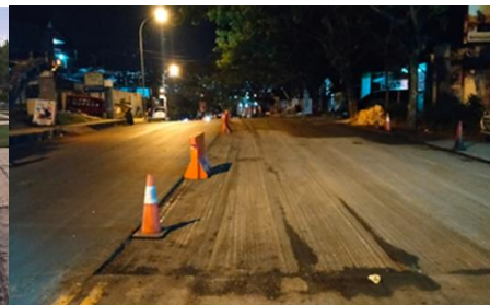
Gambar 2. Hasil Pengupasan Jalan