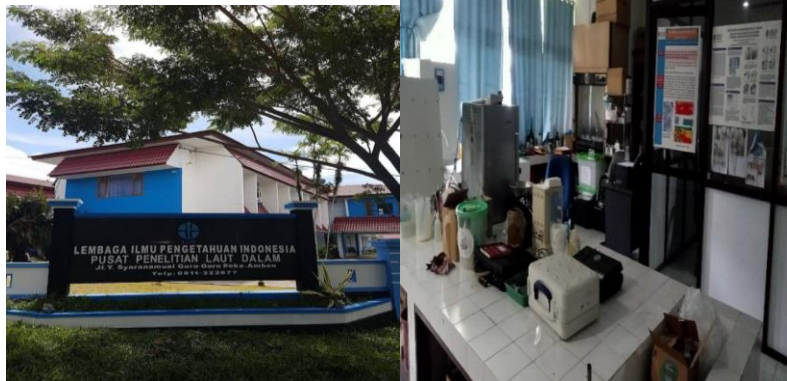
Gambar 2.2 Lokasi Penelitian Lipi