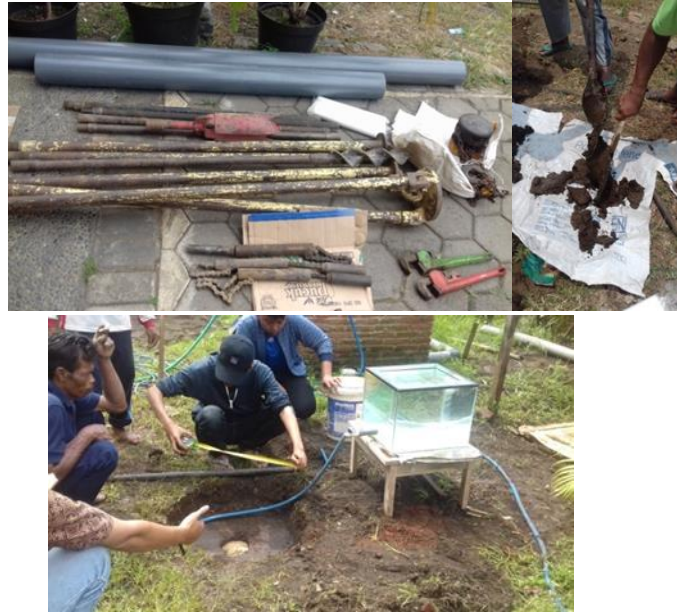
Gambar 1. Alat Auger Boring dan Pengukurann Insitu Permeability Constan Head.