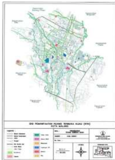
Gambar 3.2.3 Data Persebaran Ruang Terbuka Hijau Di Kota Malang

Kualitas dan jenis RTH yang tersedia di Kota Malang mencakup berbagai bentuk ruang terbuka, di antaranya taman kota, taman lingkungan atau taman RW, sempadan sungai, serta jalur hijau jalan seperti median dan trotoar vegetatif. Distribusi RTH ini cukup tersebar, namun belum sepenuhnya membentuk jaringan ekologis kota yang saling terhubung. Kebutuhan pengembangan RTH ke depan mencakup tidak hanya penambahan kuantitas, tetapi juga peningkatan kualitas fungsi ekologisnya, seperti penyerapan air, pereduksi panas, dan ruang publik inklusif.