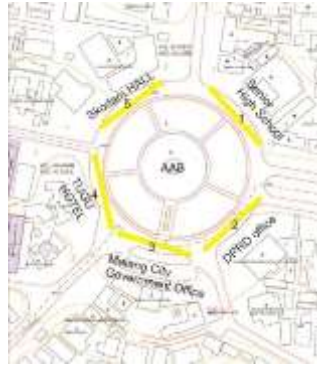
Gambar 3.2.2 Jalur Walkability AAB sebagai Potensi Koridor Hijau