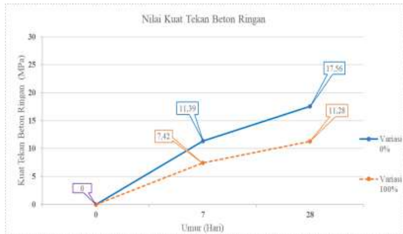
Gambar 4. Grafik Pengujian Kuat Tekan