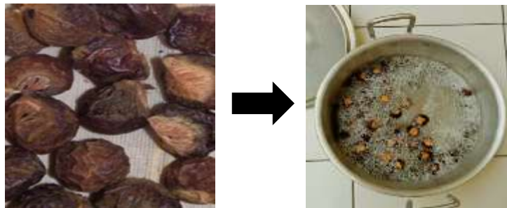
Gambar 2. Proses Pengambilan Air Lerak

Material yang kami pilih yaitu menggunakan Pasir Lumajang yang telah umum digunakan di Kota Malang dan untuk Pecahan Keramik menggunakan limbah pembongkaran rumah. Sedangkan buah lerak didapatkan dari sekitar kampus Politeknik Negeri Malang.