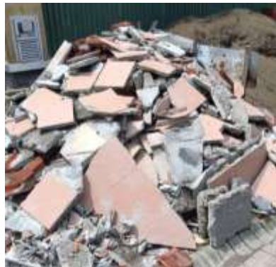
Gambar 3. Limbah Pecahan Keramik