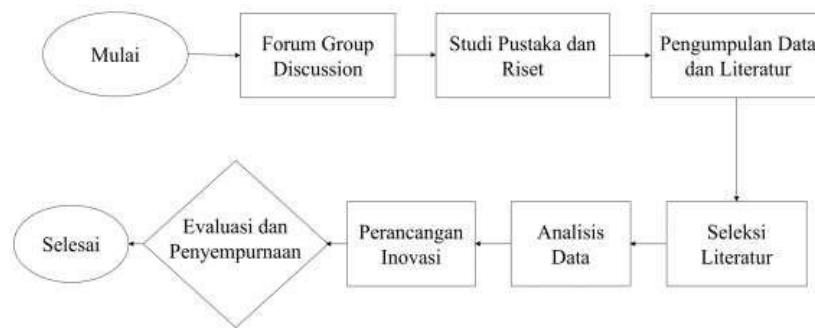
Gambar 2.4 Diagram Alir Metode Pelaksanaan