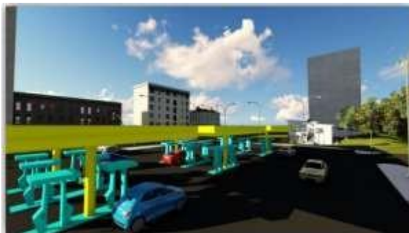
Gambar 2.3 Desain Infrastruktur Charging Station