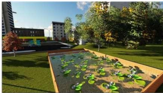
Gambar 2.2 Desain Susunan Eceng Gondok Dalam P-MFC