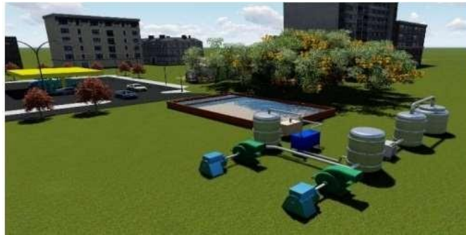
Gambar 2.1 Desain Reaktor P-MFC