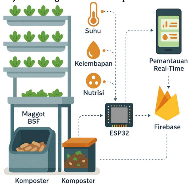
Gambar 4. Sistem AGROCITY

Salah satu temuan utama adalah keberhasilan sistem Internet of Things (IoT) dalam memantau kondisi lingkungan mikro secara real-time pada AGROCITY yang dapat dilihat pada Gambar 4.. Selama 30 hari masa implementasi, sensor suhu dan kelembapan udara (DHT22), kelembapan tanah ( Soil Moisture Sensor ), intensitas cahaya (BH1750), dan kadar nutrisi (TDS/EC Sensor) bekerja stabil dan konsisten yang dijelaskan pada Tabel 1.. Data dikirim ke Firebase melalui ESP32 dan ditampilkan melalui aplikasi AGROCITY yang dirancang khusus untuk pengguna dalam monitoring. Tampilan grafik sederhana dan notifikasi otomatis, pengguna dapat mengetahui kapan waktu optimal untuk menyiram tanaman atau menambahkan nutrisi.