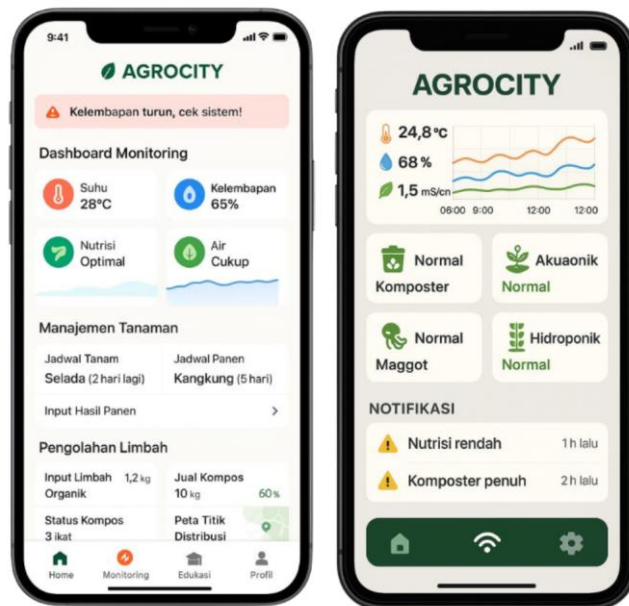
Gambar 3. Aplikasi AGROCITY

Tahapan awal dimulai dengan pengamatan lapangan dan telaah literatur terhadap isu-isu perkotaan yang berkaitan dengan alih fungsi lahan, ketahanan pangan, serta akumulasi limbah organik. Pengamatan ini difokuskan pada area permukiman padat, yang umumnya tidak memiliki akses terhadap ruang budidaya pangan atau sistem pengolahan sampah berbasis komunitas. Temuan dari pengamatan tersebut digunakan sebagai dasar untuk merumuskan konsep AGROCITY, yakni sistem modular pertanian kota yang mampu mengintegrasikan budidaya tanaman, peternakan mikro (maggot BSF), serta pengolahan kompos dalam satu platform hemat ruang.