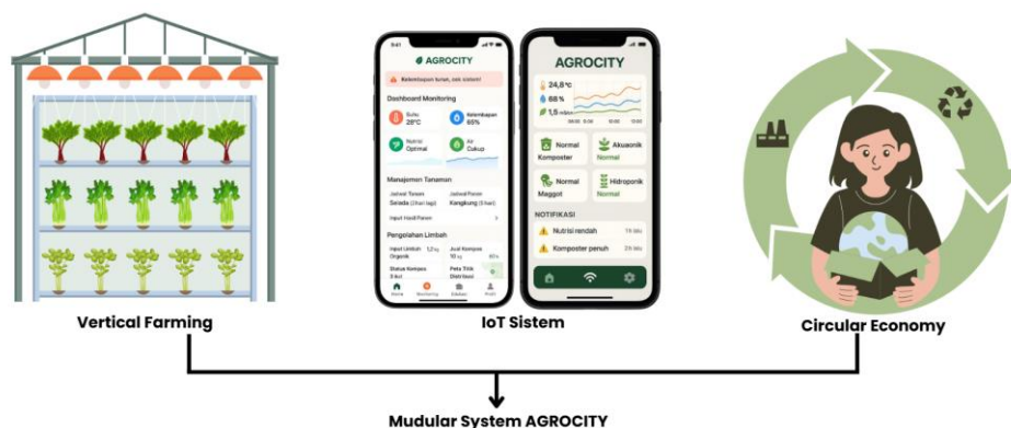
Gambar 1. Komponen pada AGROCITY

Menjawab tantangan tersebut, diperlukan pendekatan multidisiplin yang mengintegrasikan teknologi, lingkungan, dan sosial secara simultan. Konsep kota dengan pertanian urban ( urban farming ) menjadi salah satu jawaban potensial yang terus berkembang, tidak hanya sebagai metode produksi pangan alternatif di perkotaan, tetapi juga sebagai gerakan sosial-ekologis yang mempromosikan kemandirian dan keberlanjutan (Wijaya et al., 2020). Namun, sebagian besar praktik urban farming di Indonesia masih bersifat konvensional, tidak terintegrasi, dan memiliki daya jangkau yang terbatas (Pengabdian et al., 2025). Oleh karena itu, penting untuk mengembangkan inovasi perkotaan dengan pertanian urban yang bersifat modular, efisien, cerdas, dan mampu meregenerasi limbah menjadi sumber daya baru, sejalan dengan prinsip ekonomi sirkular. Untuk itulah AGROCITY dihadirkan sebuah sistem pertanian urban membangun kota hijau berbasis Internet of Things (IoT) dan ekonomi sirkular yang dirancang khusus untuk mengoptimalkan ruang terbatas, mengolah limbah organik menjadi kompos berkualitas, dan menghasilkan produk pangan lokal melalui mekanisme terintegrasi.