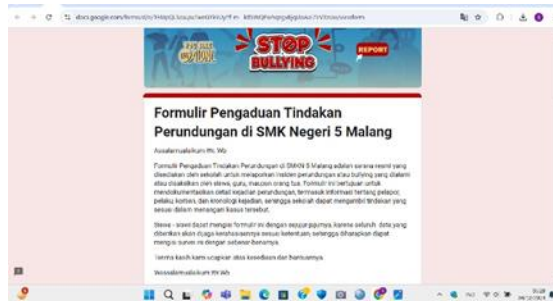
Gambar 1. Survei Kasus Perundungan di SMKN 5 Malang

Gambar diatas merupakan kegiatan survei awal yang dilakukan untuk mengidentifikasi tingkat keberadaan kasus perundungan di SMKN 5 Malang melalui platform Google Form. Survei ini digunakan sebagai langkah awal untuk memahami persepsi siswa terkait perundungan, serta untuk mengetahui tingkat frekuensi dan jenis-jenis perundungan yang terjadi. Hasil dari survei menunjukkan bahwa terdapat hambatan yang signifikan dalam melaporkan kasus perundungan, seperti rasa takut terhadap ancaman dari pelaku dan kurangnya rasa percaya diri siswa. Survei ini menjadi dasar yang penting dalam merancang intervensi berbasis teknologi, yaitu penggunaan platform Google Form untuk pelaporan perundungan.