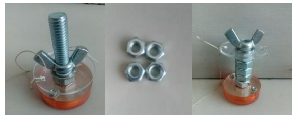
Gambar 2. Set beban yang digunakan.