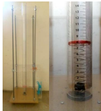
Gambar 1. Kerangka alat praktikum energi mekanik.

Pengembangan set praktikum dilakukan melalui 3 tahap yaitu uji kinerja alat, uji validasi ahli yang meliputi ahli materi dan ahli media, serta uji coba lapangan yang dilakukan pada siswa SMAN 77 Jakarta. Produk yang dihasilkan dalam pengembangan ini merupakan sebuah media pembelajaran berupa set praktikum energi mekanik pada materi hukum kekekalan energi mekanik di SMA. Set praktikum yang dihasilkan dapat memperlihatkan pada peserta didik peristiwa energi mekanik melalui percobaan saat benda dijatuhkan hingga mengenai pegas. Sehingga peserta didik dapat mengamati pergerakan benda saat dijatuhkan dengan menggunakan massa yang berbeda dan perubahan panjang pegas sebelum dan sesudah tertekan oleh benda. Peserta didik dapat menganalisis hubungan antara energi potensial dan energi kinetik benda serta dapat menghitung nilai konstanta pegas yang dihasilkan melalui persamaan hukum kekekalan energi mekanik. Tampilan set praktikum yang telah dihasilkan ditunjukkan pada Gambar 1 dan Gambar 2. Adapun tampilan hasil uji coba set praktikum energi mekanik dengan menggunakan bantuan dari aplikasi slow motion video frame player ditunjukkan oleh Gambar 3.